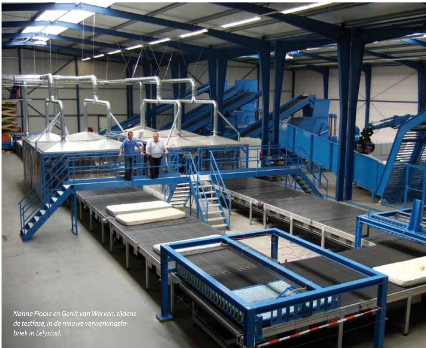
Nanne Fioole en Gerrit van Werven, tijdens de testfase, in de nieuwe verwerkingsfabriek in Lelystad.

Fioole en Gerrit van Werven probeerden enkele jaren geleden de slaapbranche achter hun plan te krijgen om gezamenlijk de recycling aan te pakken. Ook dat mislukte. Daarna begonnen de heren met eigen geld en eigen risico een fabriek te bouwen in Dronten. Ze ontwikkelden zelf de machines, maar nog in de testfase brandde de fabriek november jongstleden af. Op 15 januari dit jaar kregen