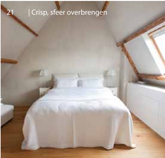
21 | Crisp, sfeer overbrengen