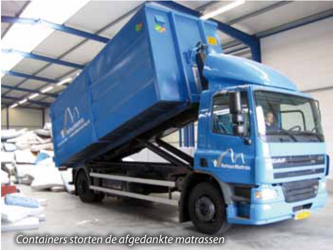
Containers storten de afgedankte matrassen