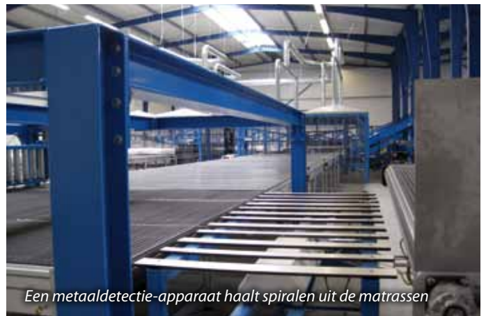
Een metaaldetectie-apparaat haalt spiralen uit de matrassen

Fioole en Van Werven de sleutels van een nieuw pand. Op 15 april arriveerden de machines en 26 mei was de officiële opening. Een moment om het glas te heffen op een indrukwekkend proces in een prachtige fabriek.