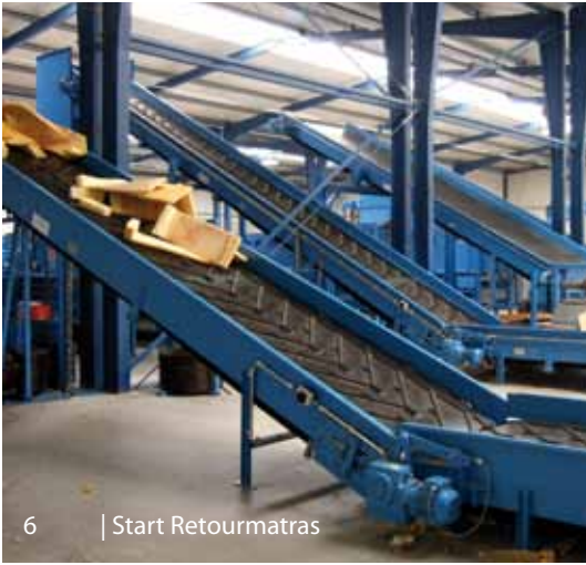
6 | Start Retourmatras