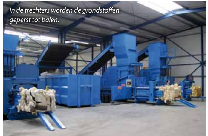
In de trechters worden de grondstoffen geperst tot balen.