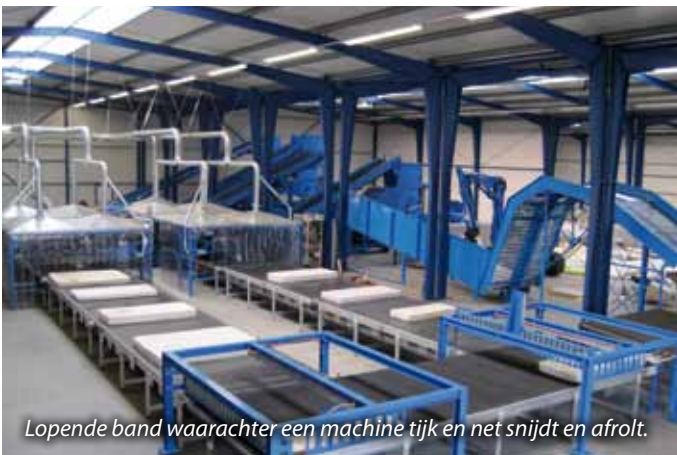
Lopende band waarachter een machine tijk en net snijdt en afrolt.