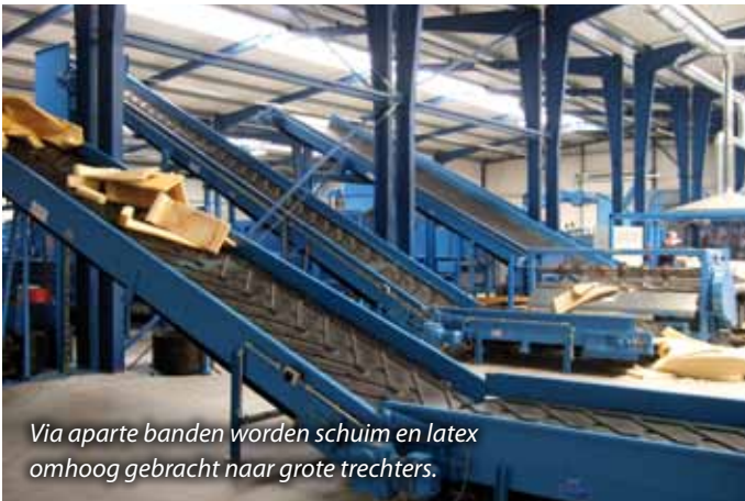
Via aparte banden worden schuim en latex omhoog gebracht naar grote trechters.